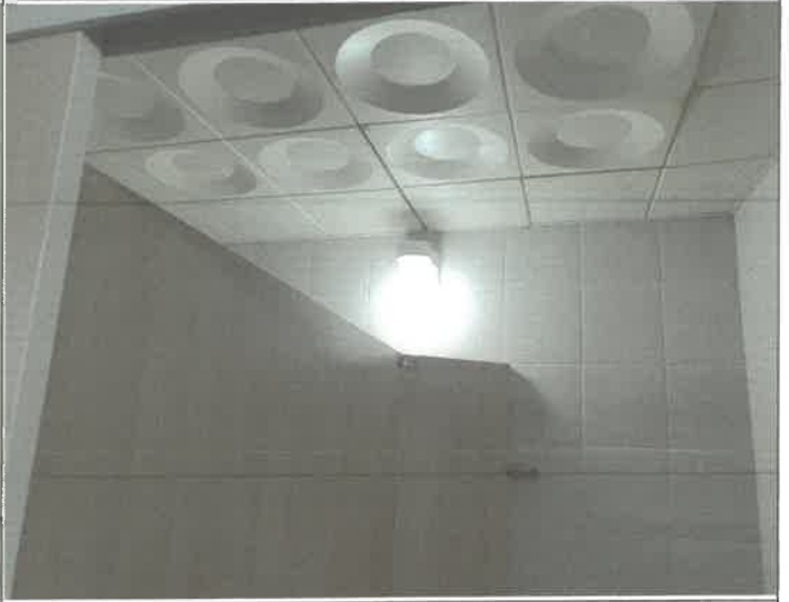
수영장 남자 샤워장 내 화장실 벽등 2개소 전구 교체