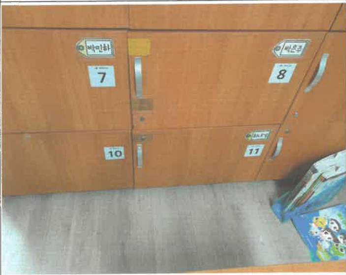
3층 피아노실 서랍장 문 탈거되어 제 설치