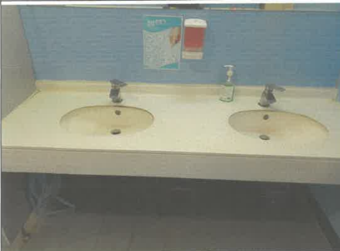
2층 남자 화장실 세면대 수전 고장 수리