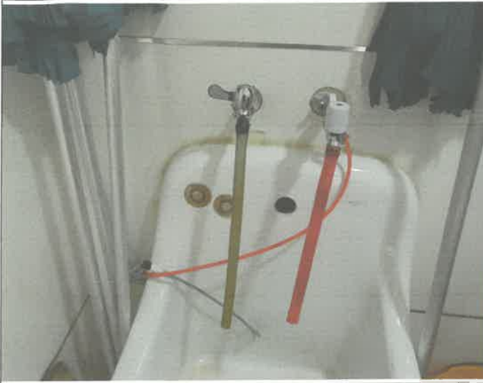
2층 청소용 개수대 수전 교체