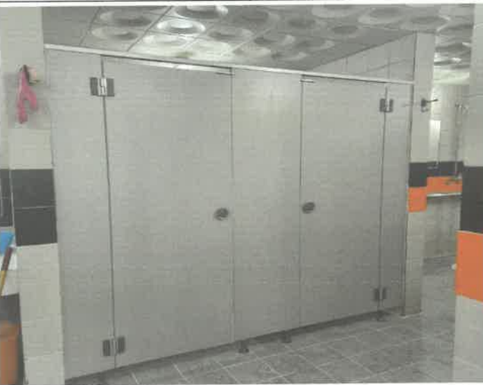
수영장 여자 샤워장 내 화장실 교체 공사