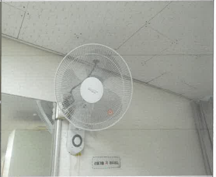
수영장 여자 탈의실 내부 벽 선풍기 교체