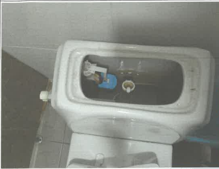
1층 남자 화장실 좌변기 물통 고정 볼트 점검 교정