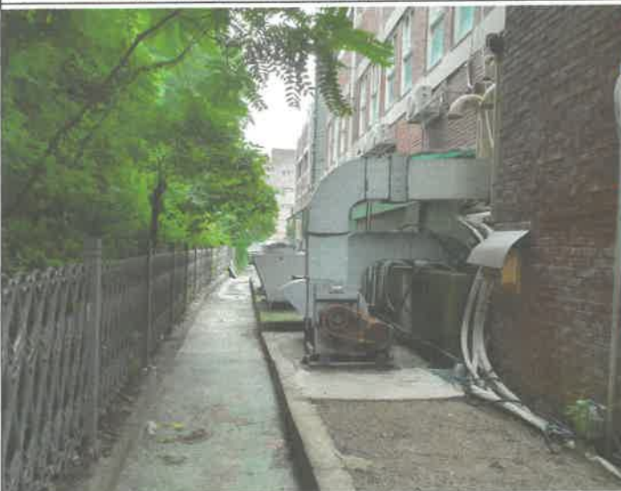
건물 후면 각종 배기팬 점검 및 구리스 주입