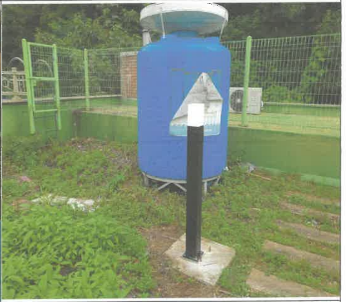
옥상 정원 등 1개소 설치