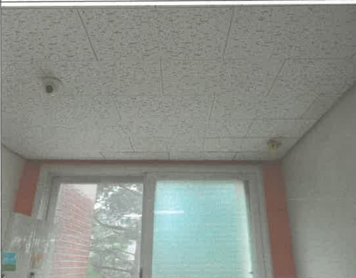
3층 복도 창문 천장 쪽 옥상 우수 배관 누수로 인한 텍스 오염 텍스 교체