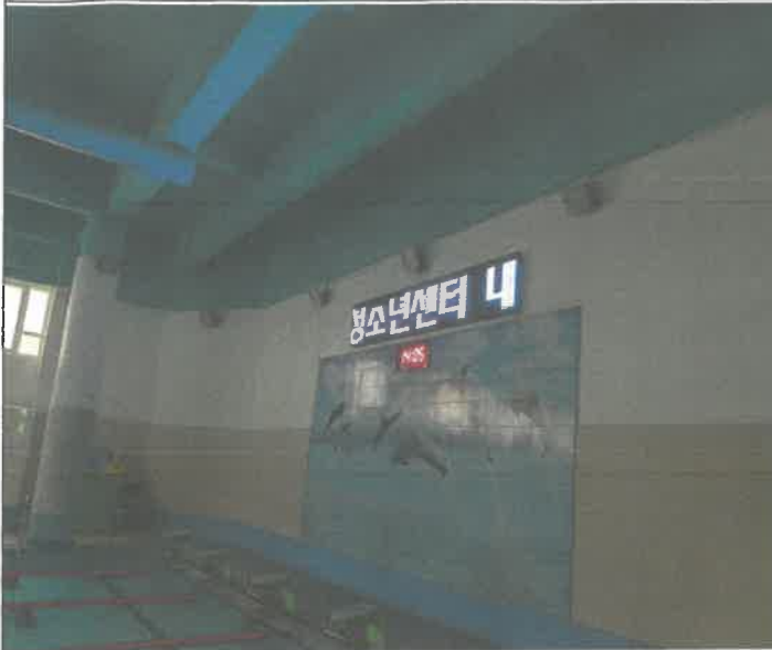
수영장 내부 전광판 전원 차단 점검 복구