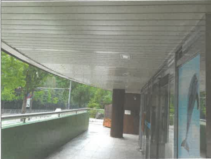
수영장 입구 외부 매입등 1기 파손 교정 부착