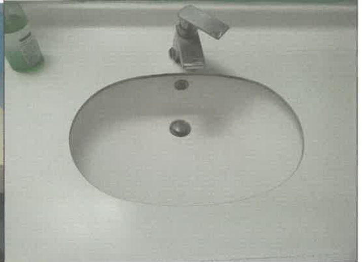
2층 여자 화장실 세면대 품업교체 및 막힘 통수