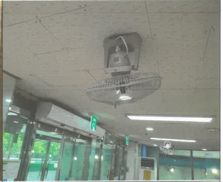
수영장 전망대 천장형 선풍기 교체 설치