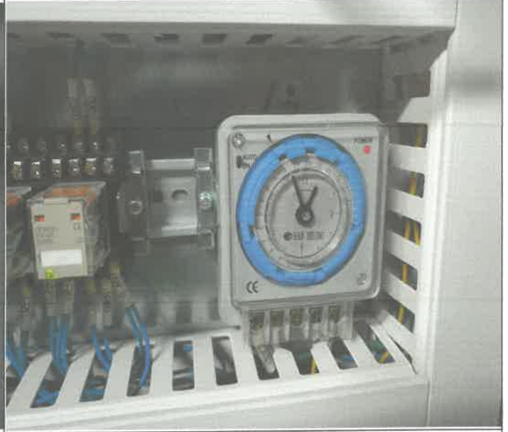
염소 발생기 응집제 아날로그 타이머 고장 교체 및 가동 시간 설정