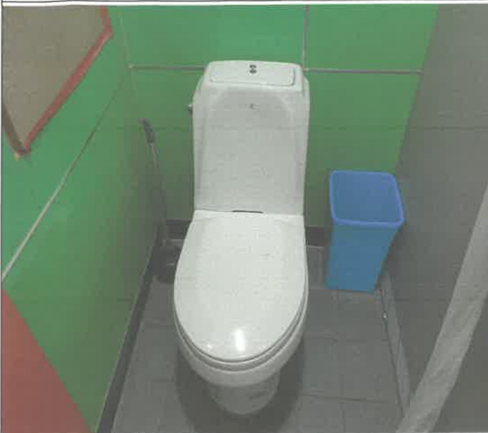
2층 여자 화장실 변기 막힘 통수