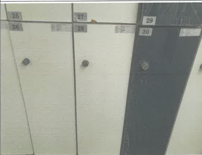
수영장 남자 탈의실 락카 탈거 되어 제설치 2개소