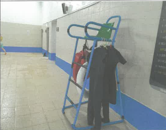
수영장 안전관리자 전망대 의자 용접수리