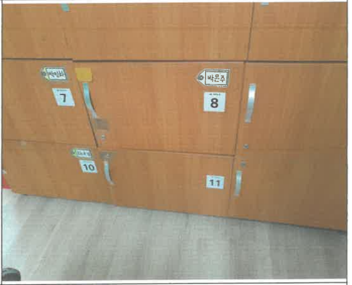
3층 피아노실 서랍장 문 탈거 되어 제설치