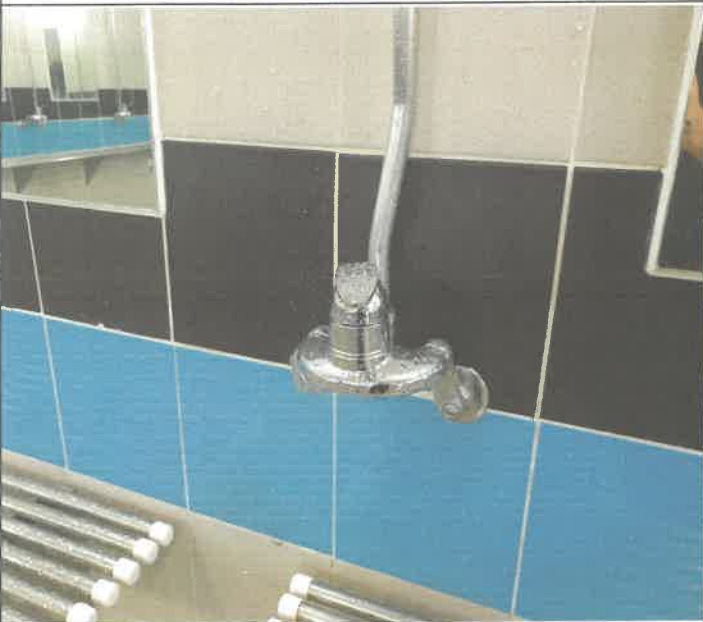
수영장 남자 샤워실 수전 1개소 교체