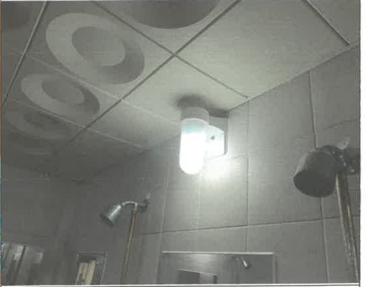
수영장 여자 샤워장 벽 등 탈거 되어 제 설치 및 전구 교체 1개소