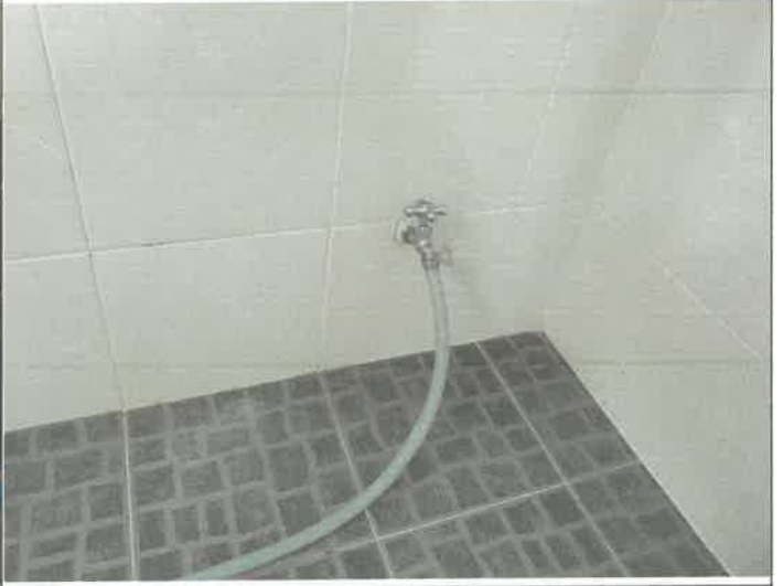
대체육관 여자 샤워실 내부 청소용 호수 재 설치