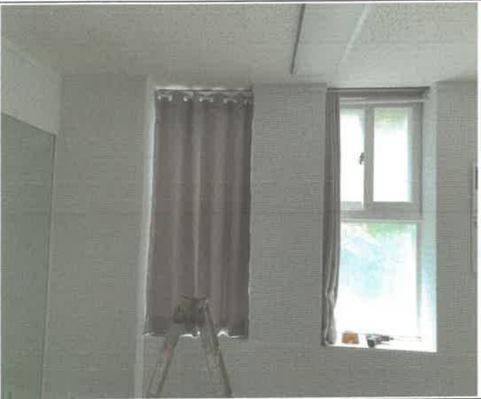
2층 유스 4실 커튼 탈거 되어 제설치