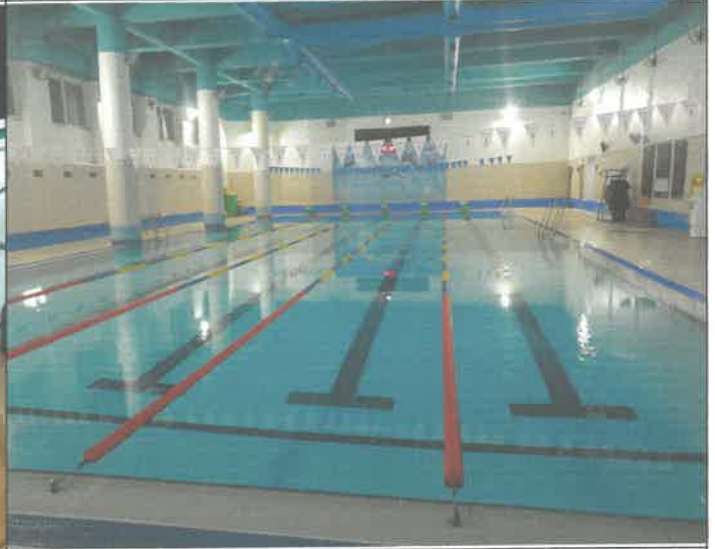
수영장 코스로프 1기 와이어 절단 보수 작업 재설치