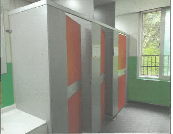
2층 여자 화장실 문짝 1개소 기능 교정