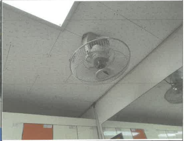
수영장 여자 탈의실 천정형 선풍기 교체 설치