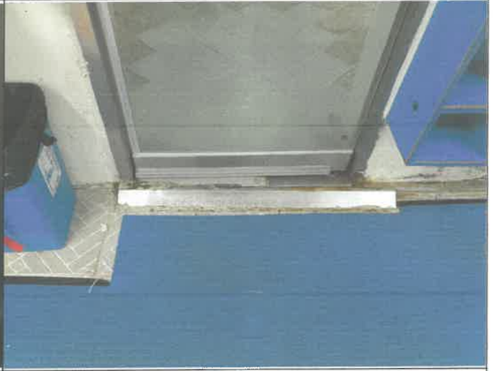
수영장 남자 샤워장 출입문 강화도어 발 끼임 방지 보호대 설치