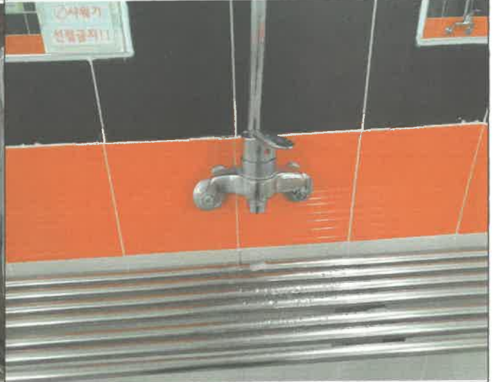
수영장 여자 샤워장 내 수전 누수 조치 완료