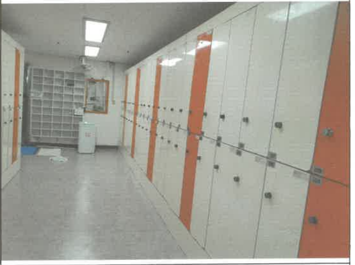
수영장 여자 탈의실 락카 키움치 1개소 교체