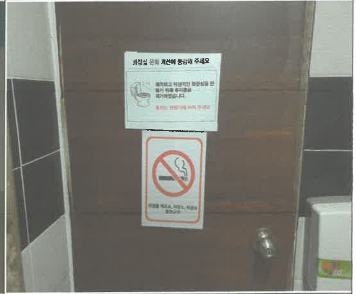
수영장 내 위험물 저장소 흡연 금지 표스터 게시