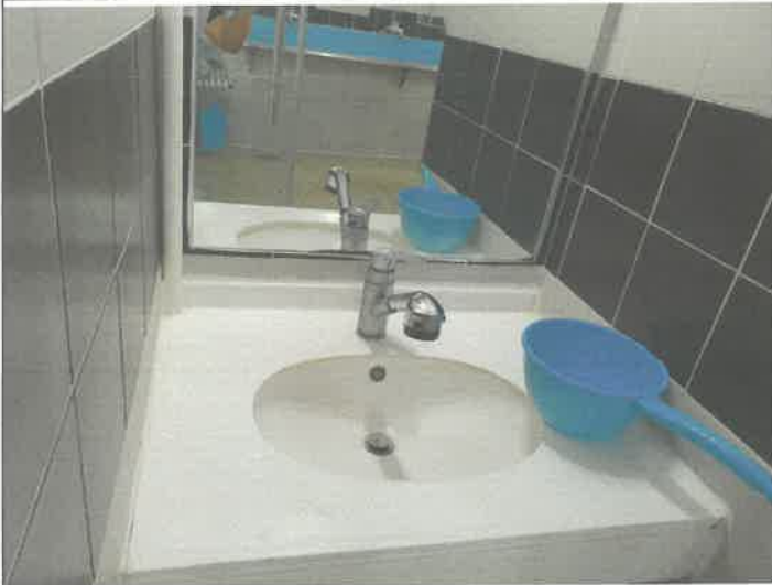
수영장 남자 샤워실 내부 세면대 수전 노즐 교체