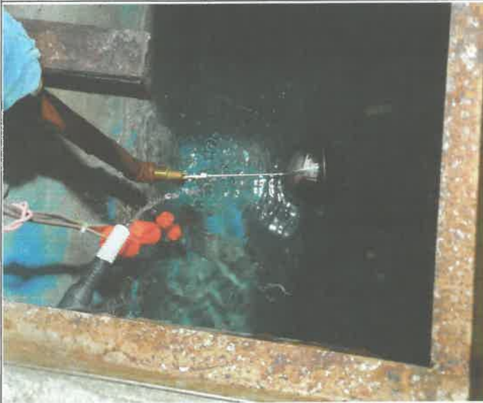
수영장 비트 바란싱 탱크 불탑 교체