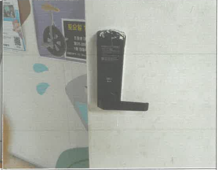
지하 1층 제과제빵실 출입문 건전지 교체