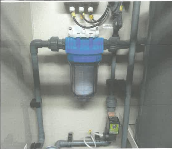
염소 발생기 필터 교체