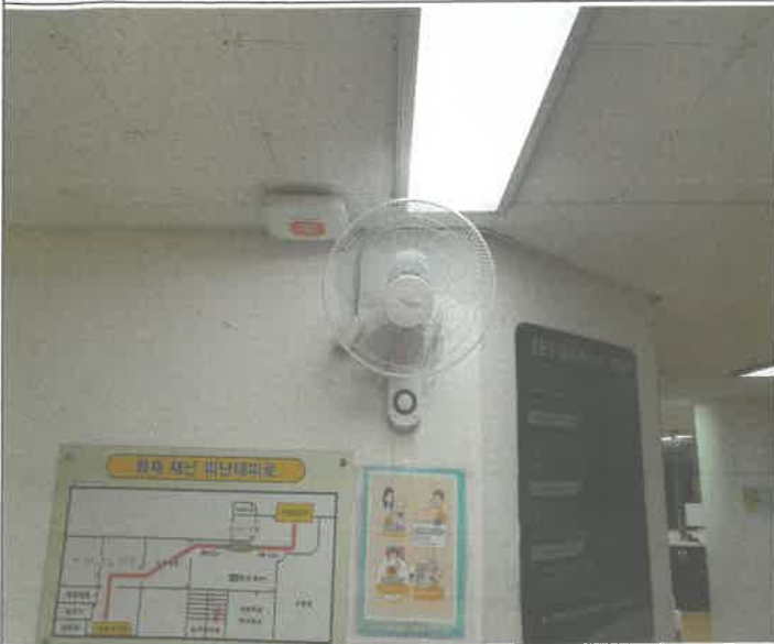
수영장 로비 벽 선풍기 교체