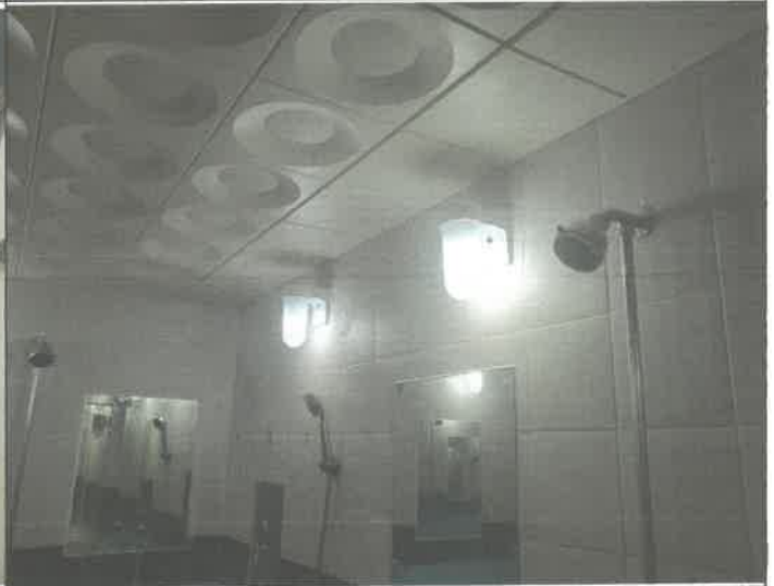
수영장 남자 샤워장 내 벽 등 3개소 전구 교체