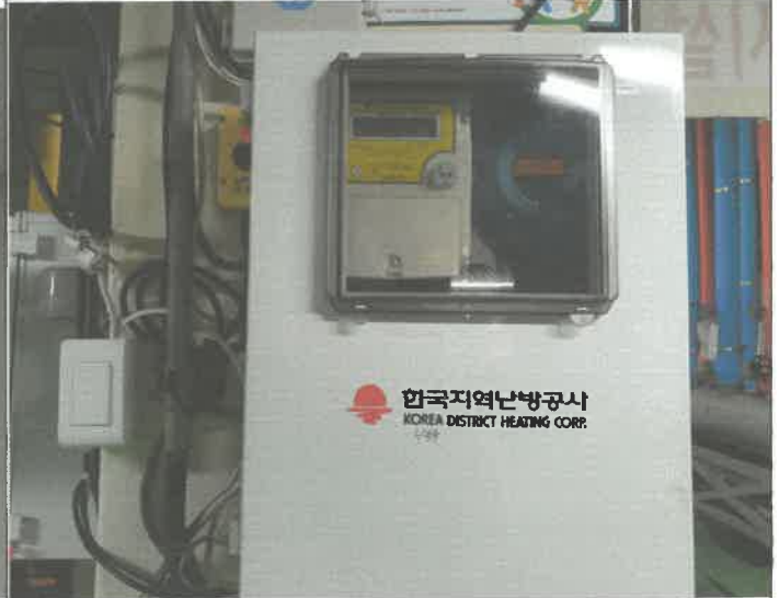
급탕 열교환기 열량계교체 (한국지역난방공사)