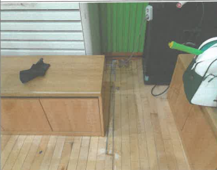
체육관 에어컨쪽 바닥 정비 및 환기구 작업