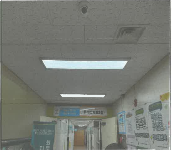
2층 중앙 복도 천장 매립등 1개소 안전기 교체